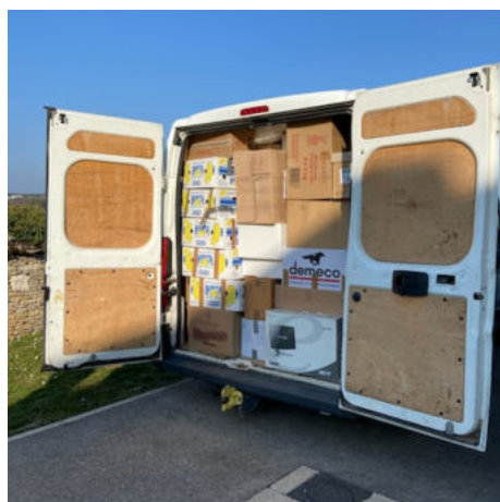
Un camion bien rempli

La Municipalité et la Commission Enfance Famille remercient chaleureusement toutes les personnes ayant répondu à leur appel à la solidarité en faveur de l'Ukraine. Une fois de plus, vous avez été nombreux à vous mobiliser pour soutenir ceux dont la vie est bouleversée par la guerre. Martin Luther King a dit : "La non-violence est une arme puissante et juste qui tranche sans blesser et ennoblit l'homme qui la manie. C'est une épée qui guérit". Souhaitons que nos dirigeants du Monde entier sachent s'en souvenir pour le retour de la Paix et le Bien de tous.