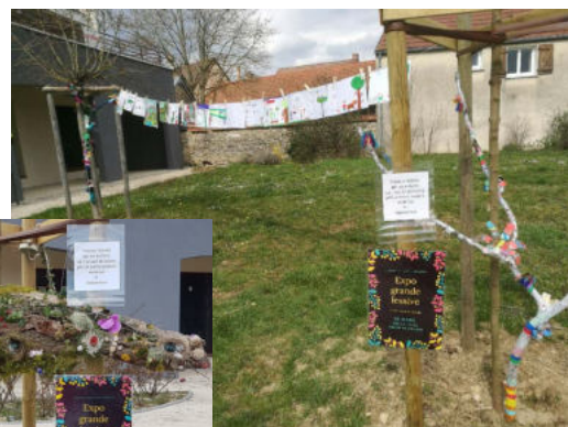
La Grande Lessive