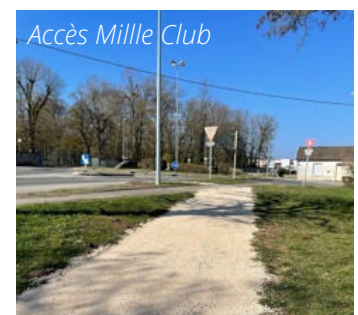
Accès Mille Club