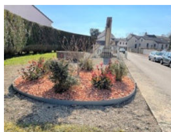
Monuments aux Morts