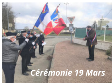
Cérémonie 19 Mars