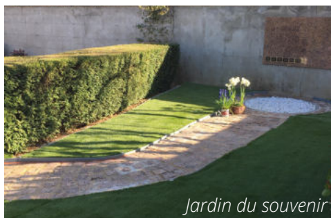
Jardin du souvenir